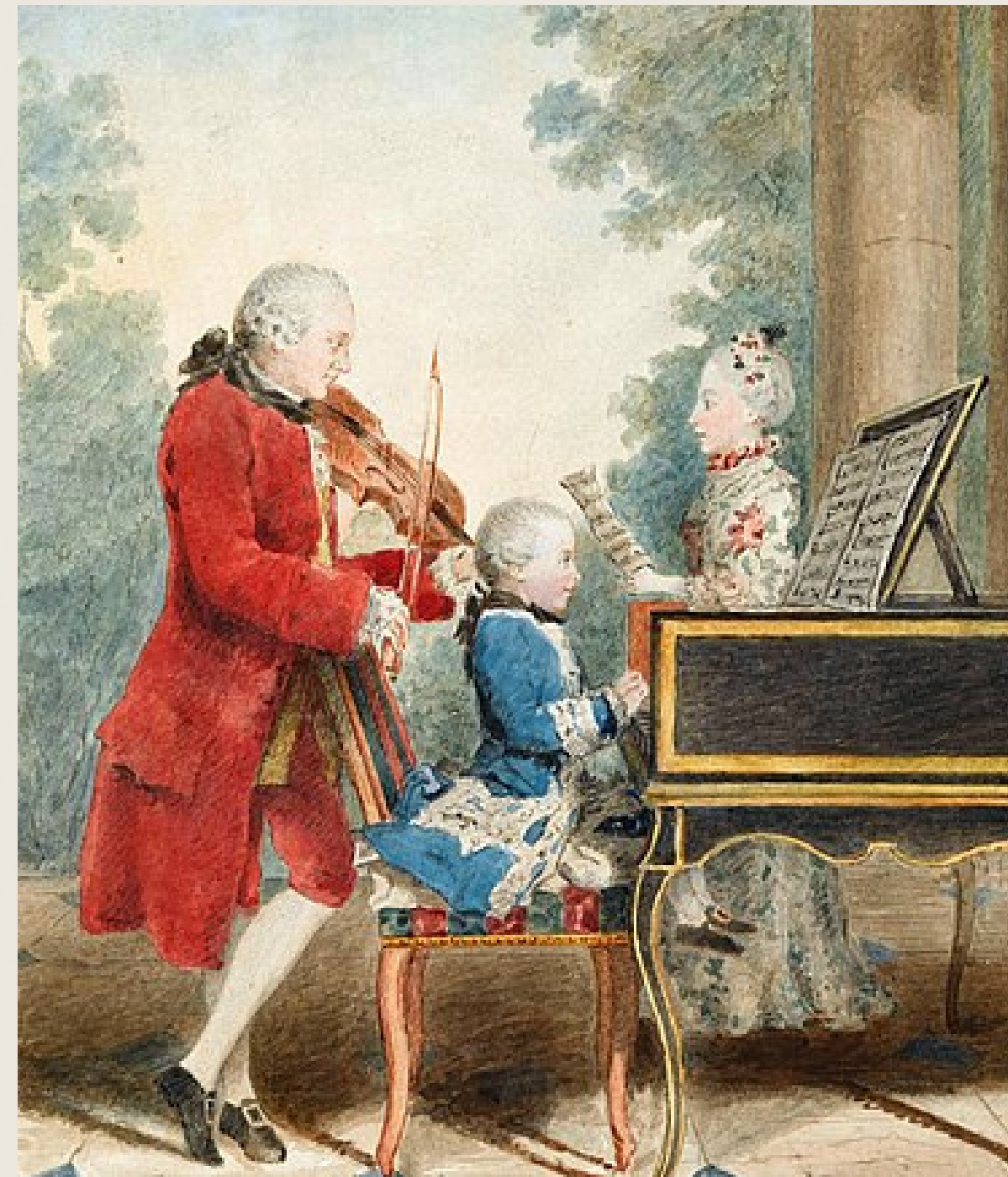
Wolfgang Amadeus Mozart (sentado ao teclado)

O período clássico, que vai de cerca de 1750 a 1820 , estabeleceu muitas das normas de composição, apresentação e estilo do gênero. Foi durante este período que o piano se tornou o principal instrumento de teclado.