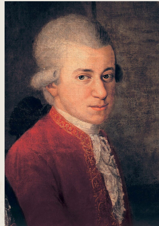
Wolfgang Amadeus Mozart

Foi um compositor conhecido por seu talento desde a infância pois começou a compor aos cinco anos de idade.